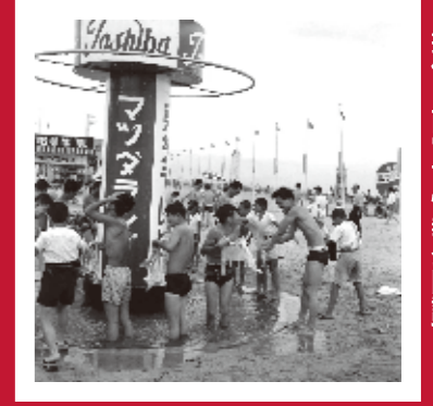
香櫨園海水浴場のシャワー 〈西宮市西波止町・昭和31年・提供＝西宮市情報公開課〉