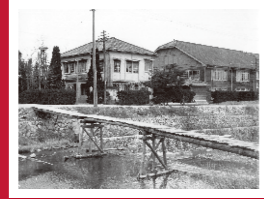
山口支所遠景 〈西宮市池田町・昭和30～40年代〉