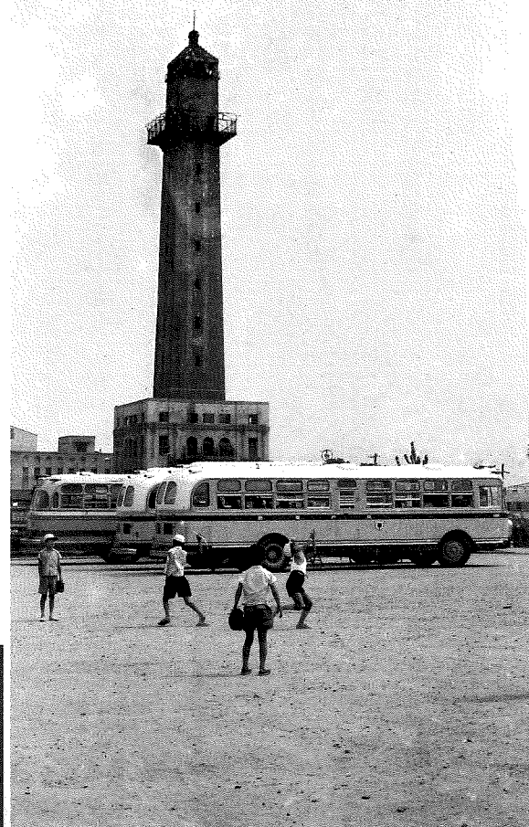
◀神戸タワー／大正13年、湊川公園に建設された高さ90メートルの塔。長くシンボルとして市民に親しまれたが、昭和43年に老朽化のため姿を消した。〈兵庫区・昭和30年代〉