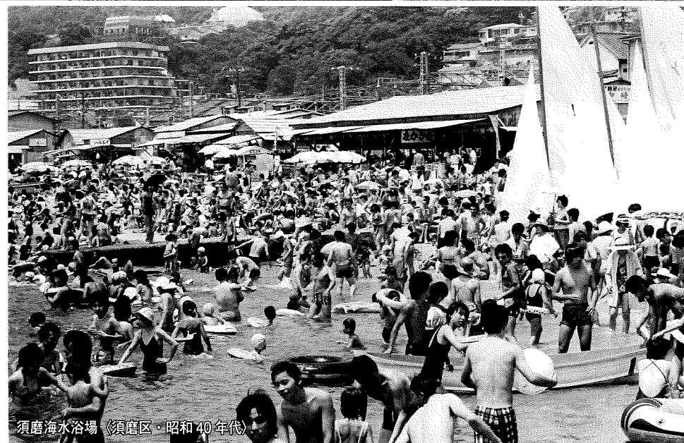
須磨海水浴場（須磨区・昭和40年代）