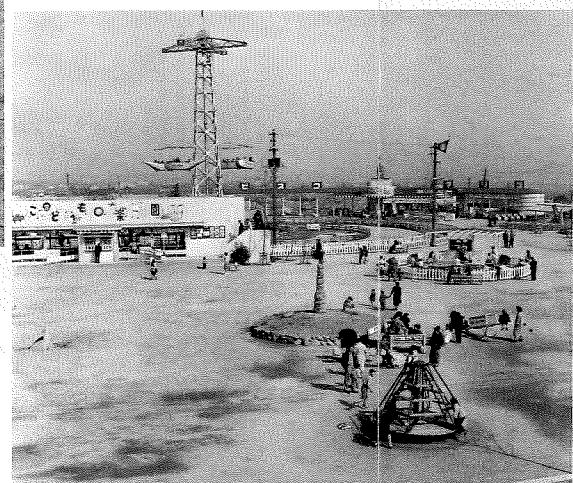
▼王子動物園の遊園地／戦前、諏訪山にあった動物園を前身に、昭和26年に開園。その前年に開催された日本貿易産業博覧会（神戸博）会場跡地を利用したものだった。動物はもちろん、多くの遊具は子どもの人気を集めた。〈灘区・昭和31年〉