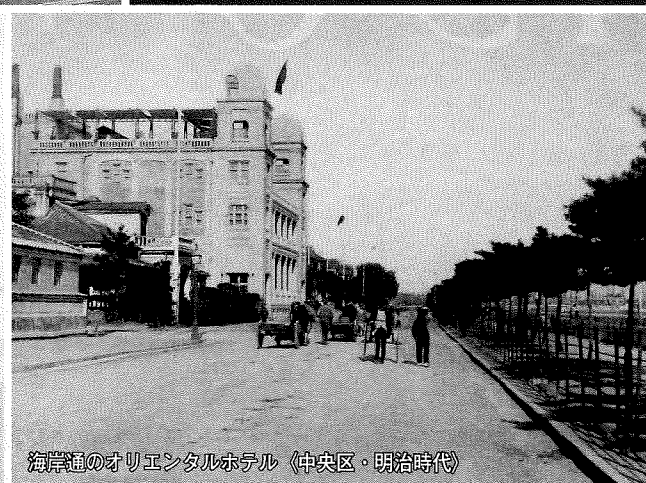
海岸通のオリエンタルホテル（中央区・明治時代）