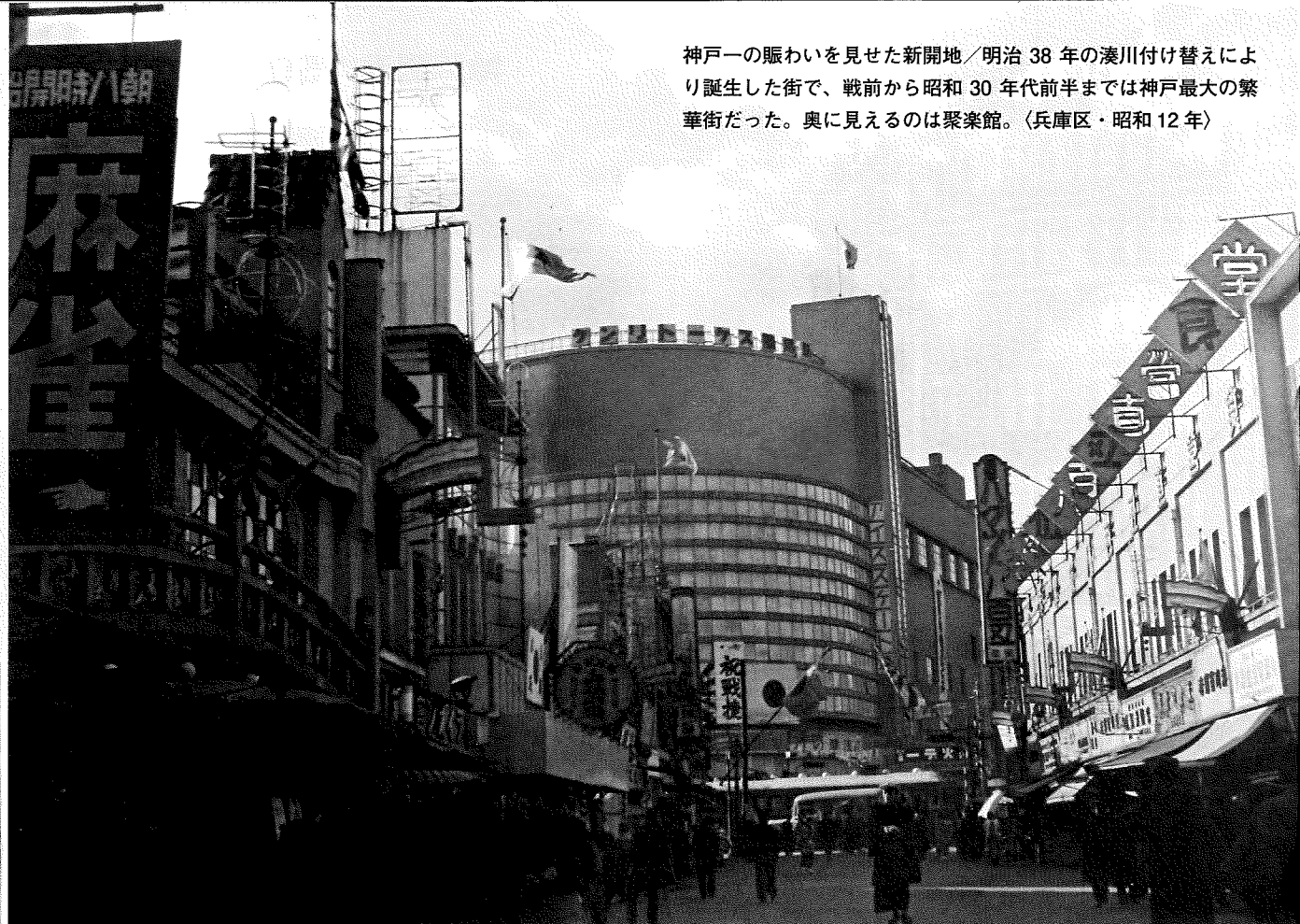
神戸一の賑わいを見せた新開地／明治38年の湊川付け替えにより誕生した街で、戦前から昭和30年代前半までは神戸最大の繁華街だった。奥に見えるのは聚楽館。〈兵庫区・昭和12年〉