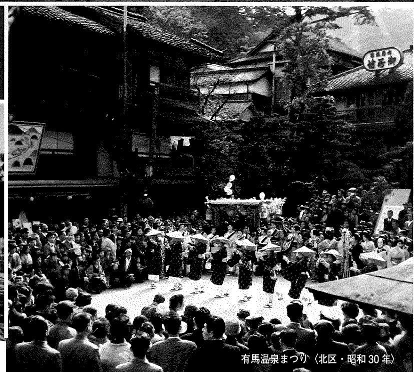
有馬温泉まつり（北区・昭和30年）