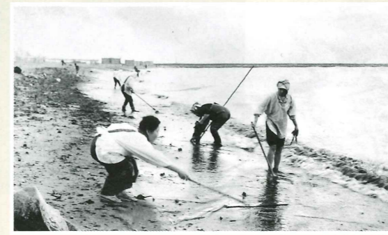
本庄東浜でワカメ採り（播磨町本庄・昭和43年）