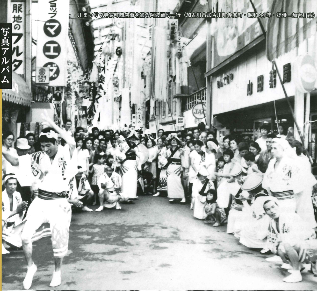
川まつりで寺家町商店街を通る阿波踊り一行（加古川市加古川町寺家町・昭和44年・提供＝加古川市）