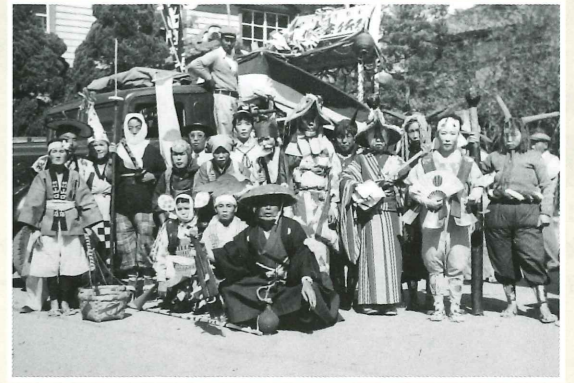
第一回稲美町民運動会で仮装行列（稲美町印南・昭和30年）