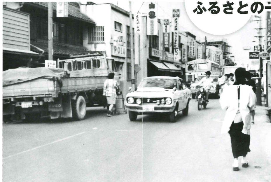
土山駅前商店街 国鉄土山駅前から北東に続く商店街で、岩本酒店、加藤時計店、田中歯科医院、のんきやの看板が並ぶ。商店街は車やバス、バイク、割烹着姿の主婦らで大賑わいである。〈播磨町上野添・昭和40年代〉