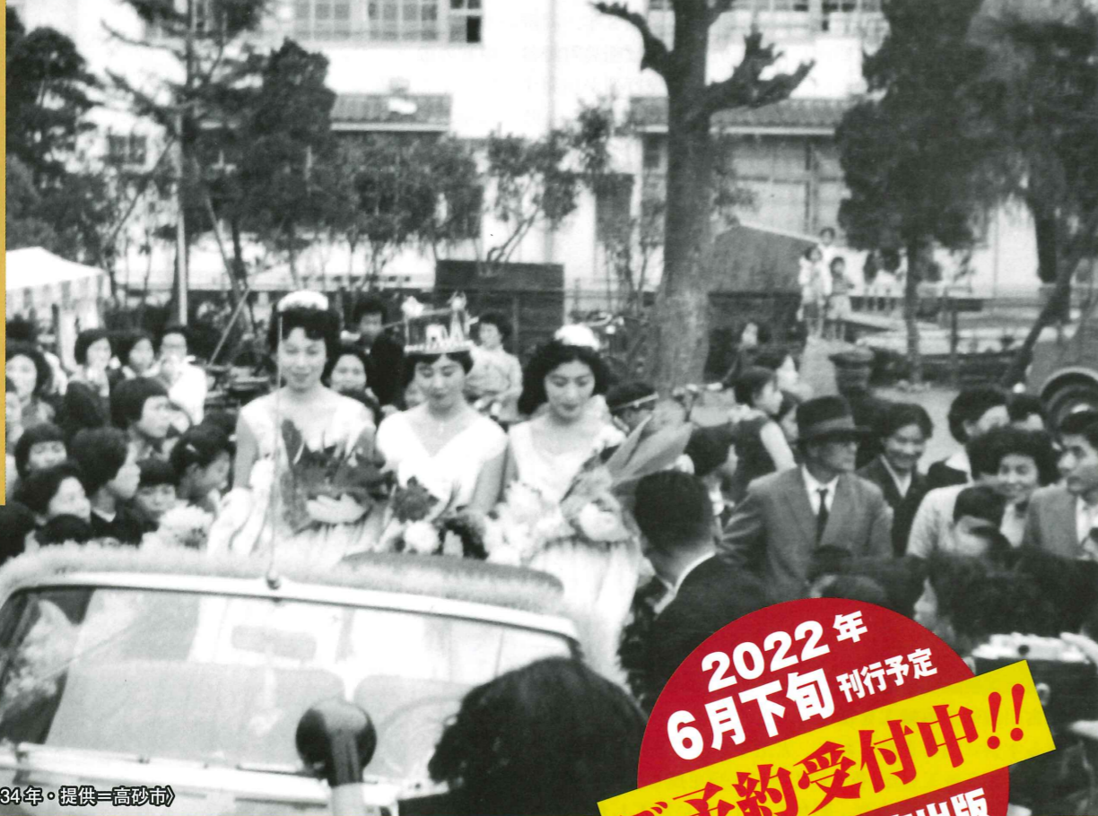
第一回ミス高砂（高砂市内・昭和34年）