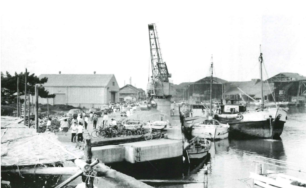
別府港 港には多くの小船が浮かび、かつての漁港の風景が見られる。また古くから東播地方の貨物輸送の要として栄えた。近くには漁業や海上交通の守り神として親しまれている住吉神社が建つ。〈加古川市別府町東町付近・昭和32年〉