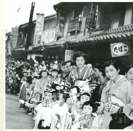
高砂神社に向かう稚児行列（高砂市高砂町東宮町付近・昭和31年頃）