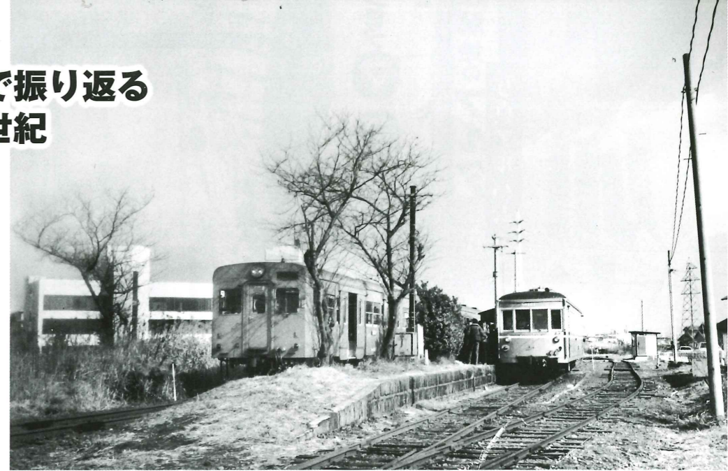
野口駅 大正2年に北在家駅として開業し、翌年に野口駅と改称した。国鉄高砂線と別府鉄道野口線の接続駅だったが、昭和59年に両線とも廃線となり、廃駅となった。左奥の建物は加古川市役所。〈加古川市野口町良野・昭和59年〉