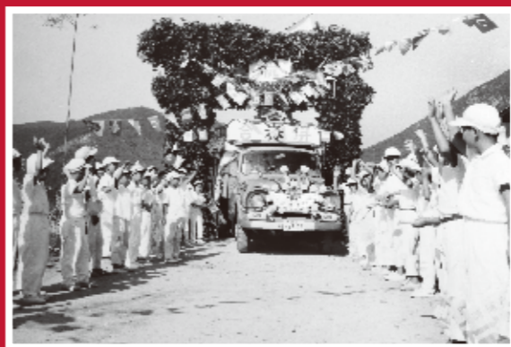
福浦地区の越境合併記念行事 《赤穂市・昭和38年》