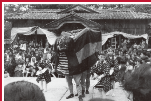
幕山神社での獅子舞 《佐用町・昭和33年》